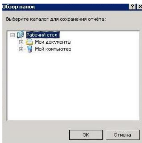
Рис.2 Окно выбора каталога для хранения документов.